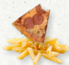
ETENS-, VLEES- EN VISRESTEN