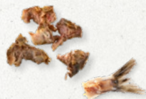
VLEES- EN VISRESTEN