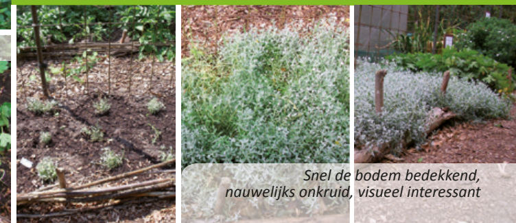
Snel de bodem bedekkend, nauwelijks onkruid, visueel interessant