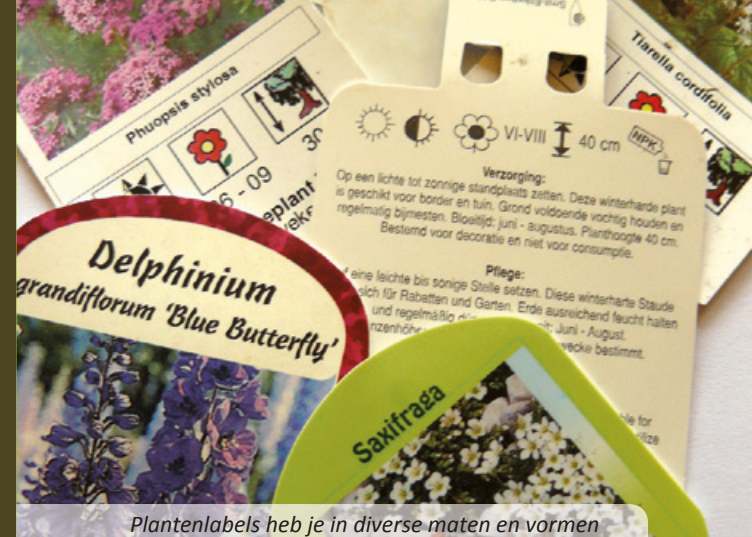
Plantenlabels heb je in diverse maten en vormen