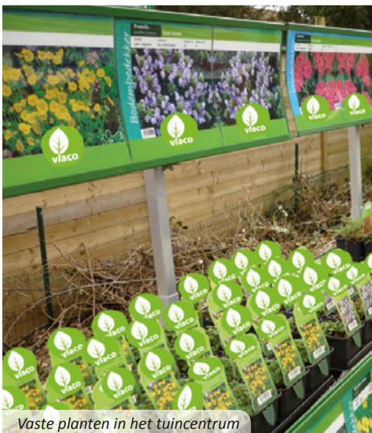
Vaste planten in het tuincentrum

In ieder tuincentrum, bij verschillende vasteplantenkwekerijen en in iedere tuin kunt u vaste planten vinden. Kiest u de vaste planten niet alleen op basis van bloei en bladkleur, maar houdt u ook rekening met hun grootte en specifieke eisen, dan zal u er lang plezier aan beleven.