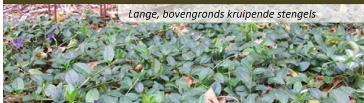
Lange, bovengronds kruipende stengels