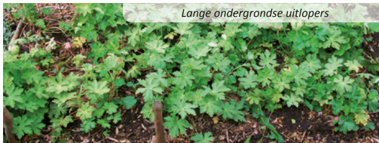
Lange ondergrondse uitlopers